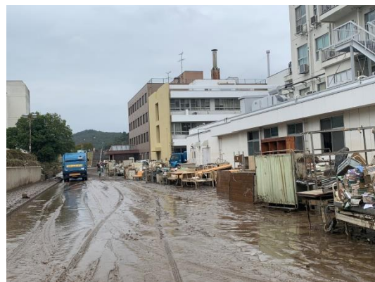
【福島県本宮市】